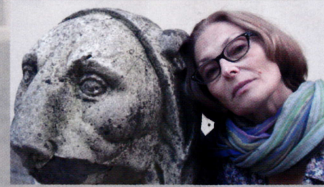
ガリーナ・コンドラシヨフ GALINA KONDRASHOVA 〈ムーブメント〉担当

1779年創立のロシア国立サント・ペテルブルグ演劇大学演技・演出学科主任教授。芸術学博士。スタニスラフスキー・システムの研究・実践の第一人者。これまで17カ国40以上の演劇大学・演劇学校で演技指導ワークショップを開催。また、イギリス(2007年RADA)、オーストラリア(2010年シドニーのNIDA)、アメリカ、ルーマニアなどで芝居を演出している。サント・ペテルブルグでの上演も数多い。また多くの俳優を育て、卒業生はモスクワ芸術座やタガンカ劇場、ペテルブルグのマーレイ・ドラマ劇場などロシアの主要な劇場で活躍している。『ワレンチン・スミイシュリヤエフ俳優・演出家・教師』『1920年—50年におけるボレスラフスキー、リー・ストラスバークのスタニスラフスキー・システム教育』など著作多数。